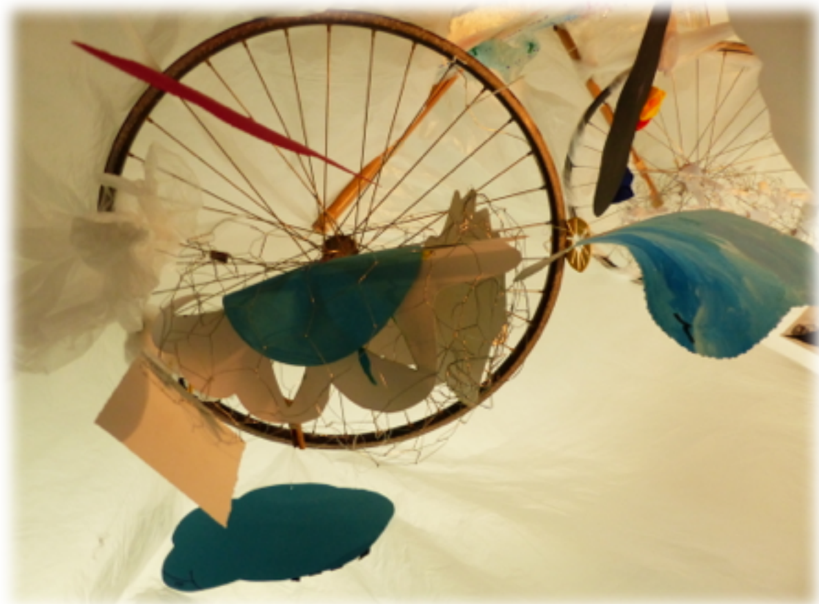
Mobile et photographie réalisés par les patients de l'hôpital de jour d'art-thérapie – CHU Purpan

Organisée par la FERREPSy Occitanie et le Service des Explorations Fonctionnelles Neurologiques - CHU Purpan